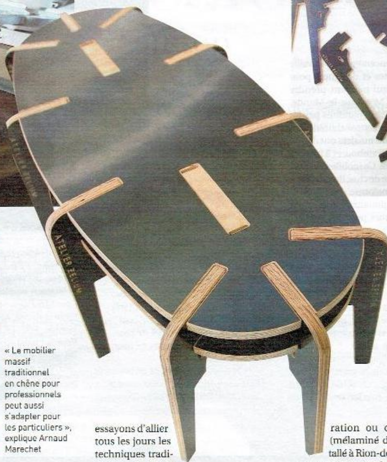
La table Tambouret conçue par Zelium, fabriquée par Asa en panneaux contreplaqués de pin en provenance de chez Rolpin. Du matériau à la fabrication, du 100 % local à monter soi-même