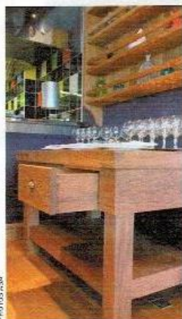
« Le mobilier massif traditionnel en chêne pour professionnels peut aussi s'adapter pour les particuliers », explique Arnaud Marechet