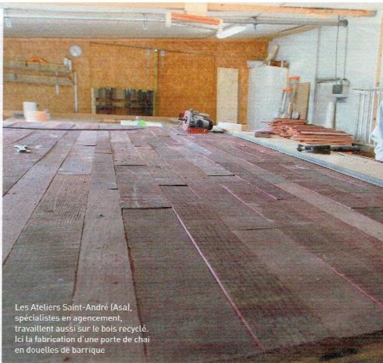
Les Ateliers Saint-André (Asa), spécialistes en agencement, travaillent aussi sur le bois recyclé. Ici la fabrication d'une porte de chai en douelles de barrique

Chênes, châtaigniers, peupliers et pins maritimes sont les essences des forêts de la région. Leur utilisation se diversifie avec une place grandissante pour le mobilier et la décoration